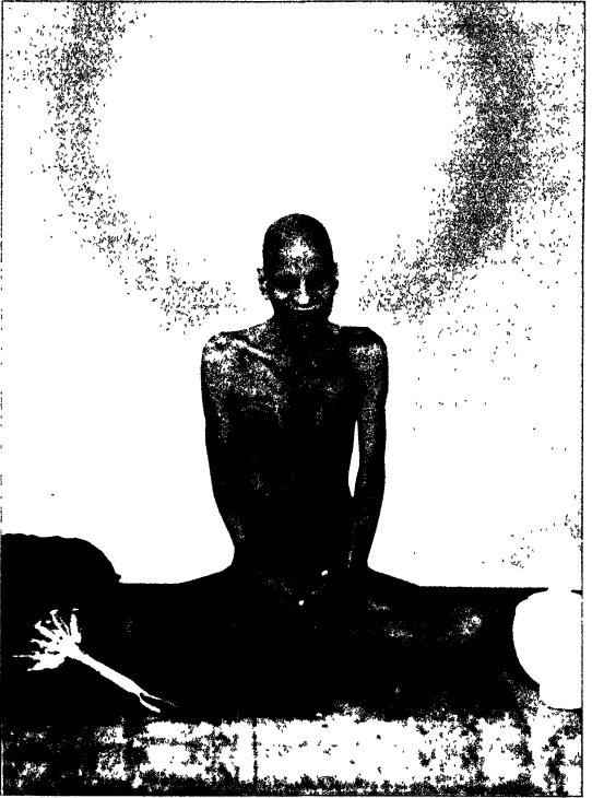
108 आचार्य श्री धर्मभूषणजी महाराज